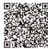
海鮮工房マルカイチ